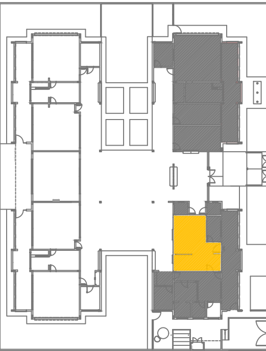
CROQUI DE REFERÊNCIA